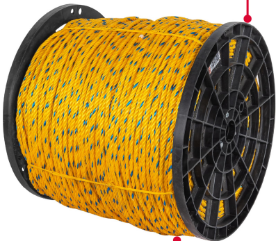
Fabricada en polipropileno