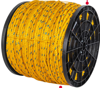
Fabricada en polipropileno