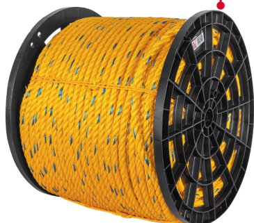
Fabricada en polipropileno