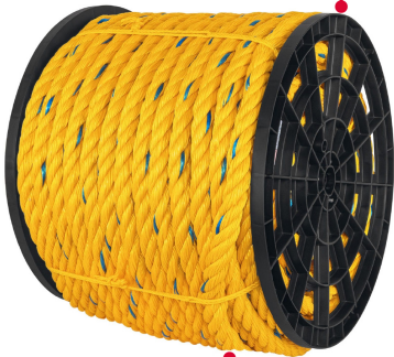
Fabricada en polipropileno