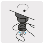
Válvula de drenado