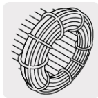
Motor con bobinas de cobre