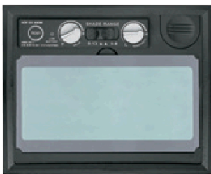
Perillas para ajuste de sensibilidad y retardo en panel digital