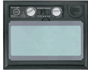
Perillas para ajuste de sensibilidad y retardo en panel digital