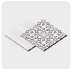
Loseta y cerámica