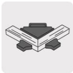
Para uniones de esquinas