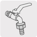
Para llaves de esfera de jardín