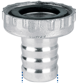
Espiga de 3/4" (19 mm)