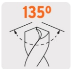
Ángulo de punta