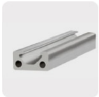
Metales no ferrosos