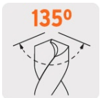
Ángulo de punta