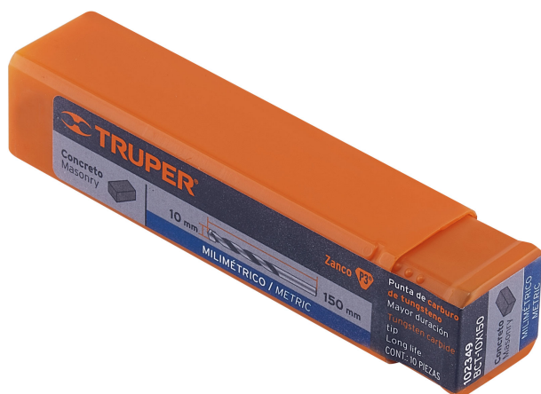
Largo total 150 mm