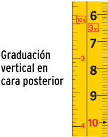
Graduación vertical en cara posterior