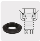
Empaque antifuga con diseño cónico