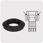
Empaque antifuga diseño cónico