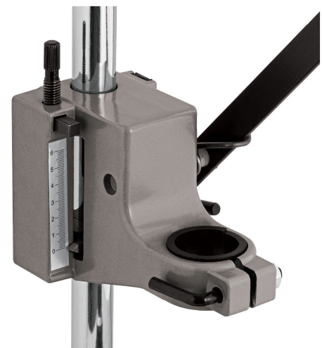
Regla graduada para mayor precisión