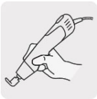
Uso tipo pluma