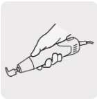
Operación a una mano