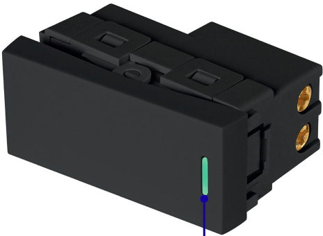
Indicador nocturno flourescente