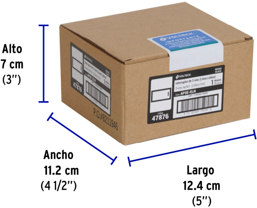
Alto 7 cm (3")