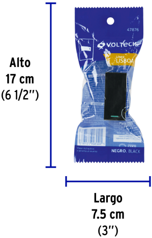
Alto 17 cm (6 1/2")