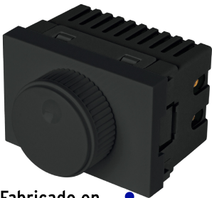
Fabricado en policarbonato