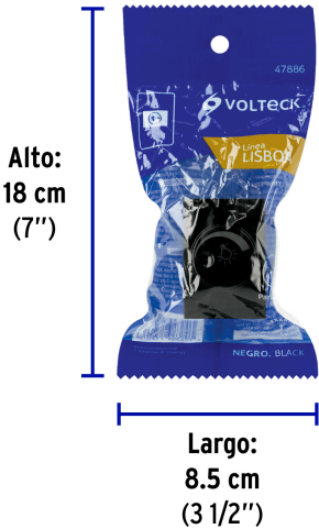
Peso: 0.03 kg (0.07 lb)