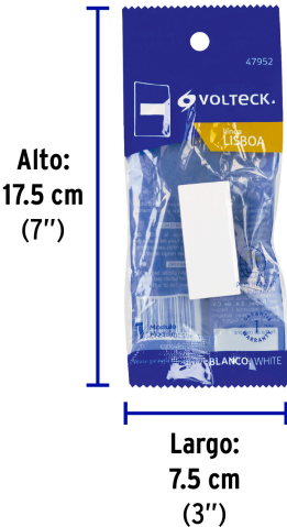
Peso: 0.005 kg (0.01 lb)