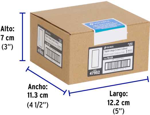
Contiene: 12 piezas