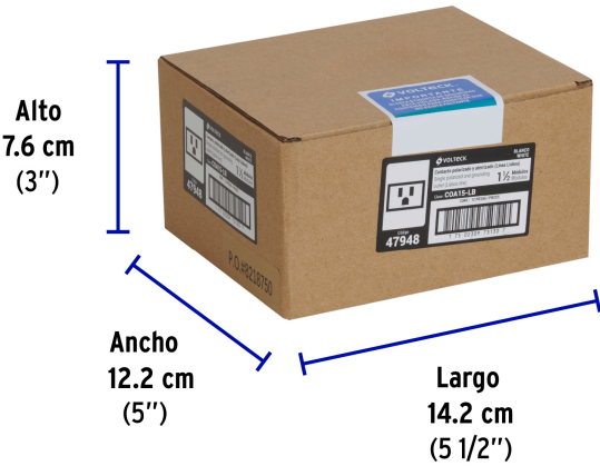
Alto 7.6 cm (3")