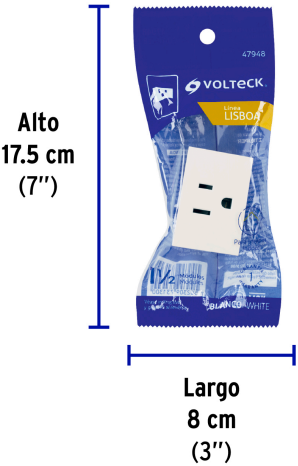
Alto 17.5 cm (7")