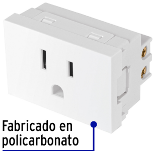
Fabricado en policarbonato