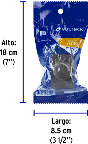
Peso: 0.03 kg (0.07 lb)