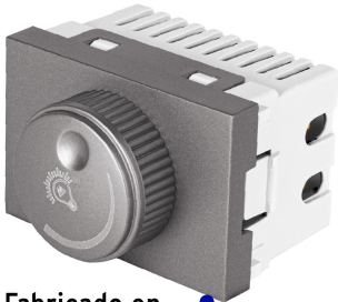
Fabricado en policarbonato