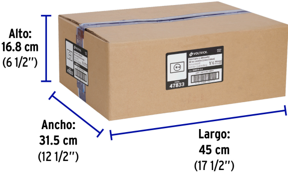
Contiene: 12 inner (144 piezas)