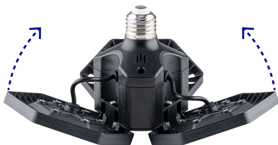
Paneles abatibles 90°