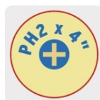
Marcado y código de color