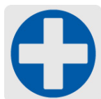
Punta de cruz