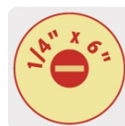
Marcado y código de color