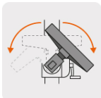
Trabajos a 45° y 135°