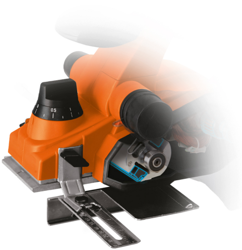
Incluye guía paralela guardada