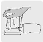
Operación a una mano