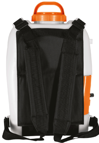
Correas ajustables para fácil transporte