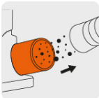
Adaptador para extracción de polvo