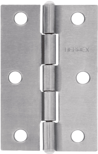
Perno remachado con cabeza media bola