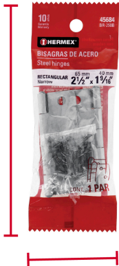
Alto: 14.5 cm (5 1/2")