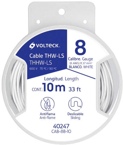
Carrete de plástico de 10 m