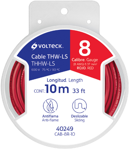
Carrete de plástico de 10 m