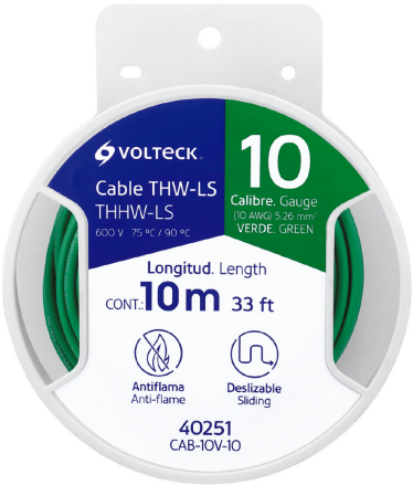
Carrete de plástico de 10 m