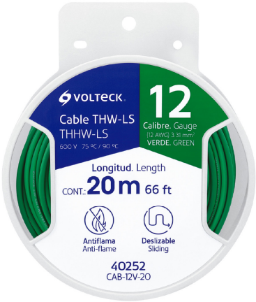
Carrete de plástico de 20 m