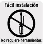
Fácil instalación No requiere herramientas