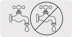
Desbaste en seco o húmedo