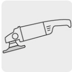
Para esmeriladora angular