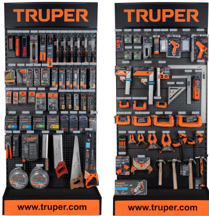
Planograma de carpintería