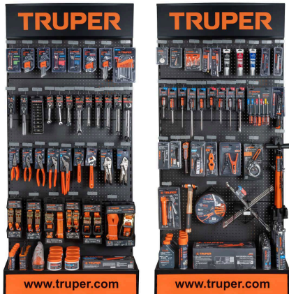
Planograma de mecánica