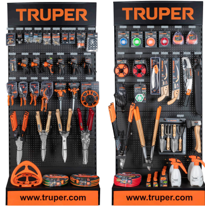
Planograma de jardinería