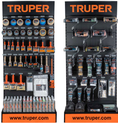
Planograma de pintura