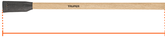
Largo 36" (90 cm)