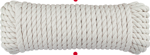
Madeja de 15 m