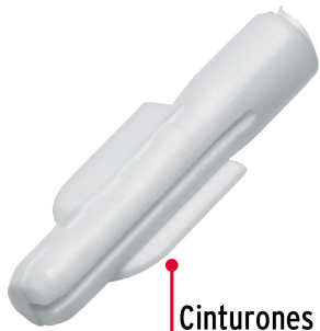
Cinturones de resistencia y anclas retráctiles de fijación