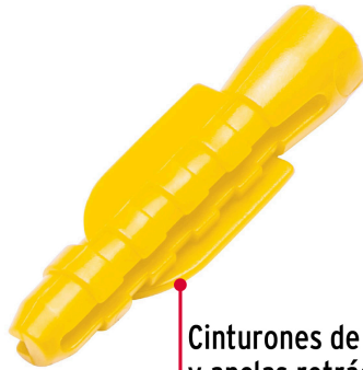
Cinturones de resistencia y anclas retráctiles de fijación