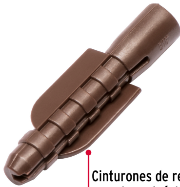
Cinturones de resistencia y anclas retráctiles de fijación