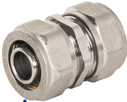
Diámetro nominal 1/2" (20 mm)