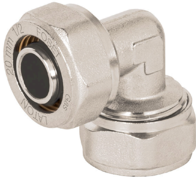
Diámetro nominal 1/2" (20 mm)