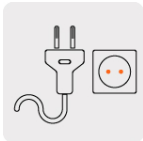
Tipo europeo (2 pines)