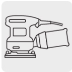
Para lijadora roto-orbital