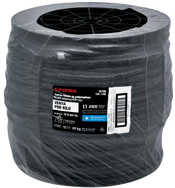
Fabricada en polipropileno