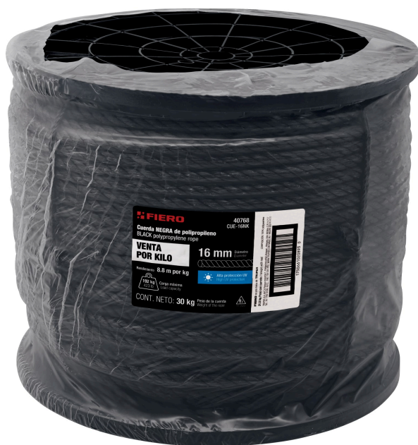
Fabricada en polipropileno

FIERO 40768 Cuerda NEGRA de polipropileno BLACK polypropylene rope VENTA POR KILO 16 mm Medida: 6.8 m por kg CONT. NETO: 30 kg Puede ser usado para... Ata estropeada Ata estropeada Ata estropeada