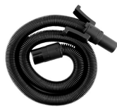
Manguera con adaptador para aspiradora