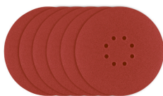
6 Discos de lija