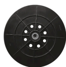
Base de fijación